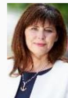
Jutta Steinruck Oberbürgermeisterin Stadt Ludwigshafen am Rhein