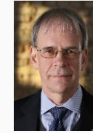
Albrecht Hornbach Präsident IHK für die Pfalz